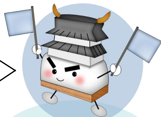
アクティブシニア 応援ポイント事業 マスコットキャラクター 「はっするきゃっする」