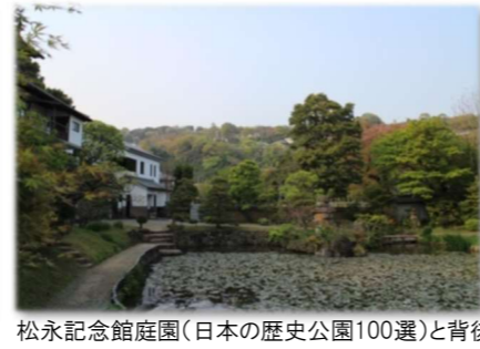
松永記念館庭園(日本の歴史公園100選)と背後の斜面林