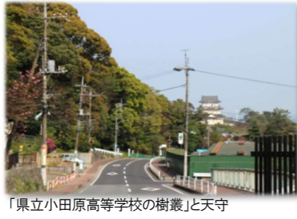
「県立小田原高等学校の樹叢」と天守