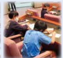
▲アンケートを熱心に記入