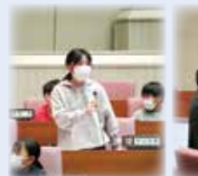
・議員になって大変だったことは？ ・どうやって市民の声を聞いているの？