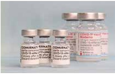
▲追加接種（3回目接種）で使用するファイザー社および武田／モデルナ社のワクチン

すでに令和3年3月に接種を終了した市民には、同年11月に接種券を発送、12月に接種を開始しており、今後も順次実施していく予定となっている。 なお財源は全て国庫負担となる。