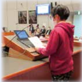
▲議員と市長が登壇する演壇を使い発表