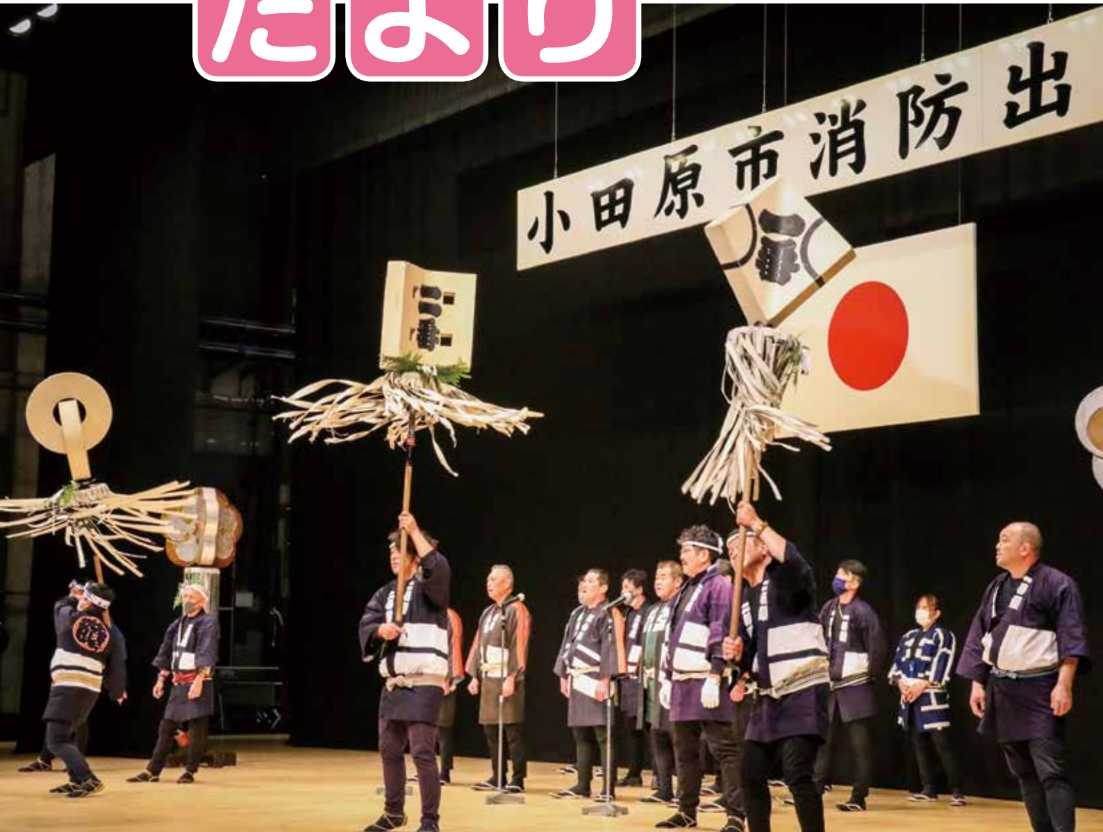
三の丸ホールでの消防出初式 (まとい振り込み)