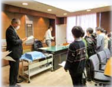
▲議長室（執務中の議長と対面）