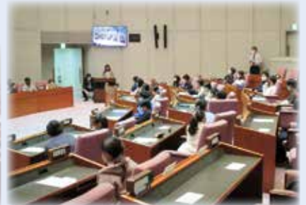
▲発表に対して議員が講評をしました