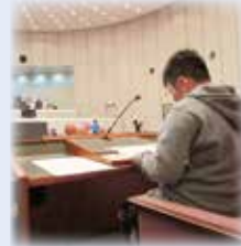
▲司会進行は議長席で