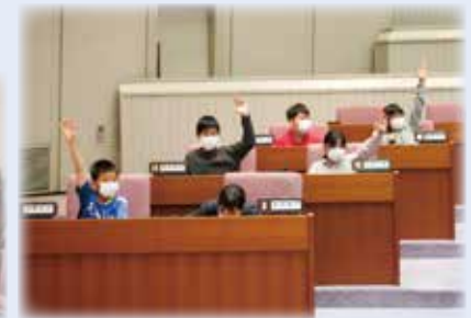
▲議会の進め方になって、児童は議員席から ▼質問し、議員は執行部席から答弁しました。