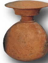
国府津三ツ俣遺跡