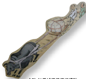
史跡 江戸城石垣石丁場跡