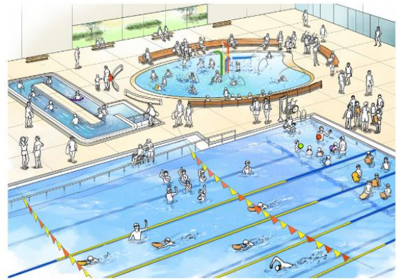
水中運動機能のイメージ

健康増進のサポートを行う専門家により、一人ひとりに合わせた運動プログラムの提供や指導が行われます。幅広い世代が遊べるボールプールやトランポリンなどの運動遊びエリアでは、全身を使って遊ぶことで、知らず知らずのうちに運動機能が向上し、健康につながります。