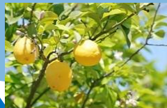
農産物のブランド化