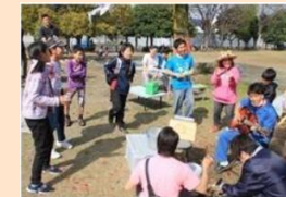
子どもの居場所 (プレイパーク)