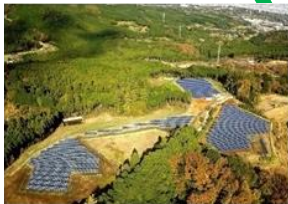
再生可能エネルギーの取組