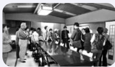
▲昨年ようす(清風楼)