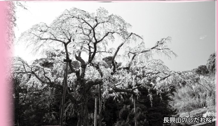
長興山のしだれ桜