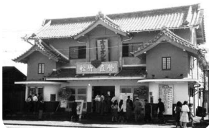
▲市内にあった映画館・オリオン座(昭和30年頃)