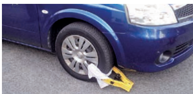
タイヤロック 差し押さえた自動車などは、移動できないようにタイヤロックします

市では昨年度から始め、差し押さえたオートバイ1台、原動機付自転車1台が落札され、その売却代金を滞納された市税に充てました。