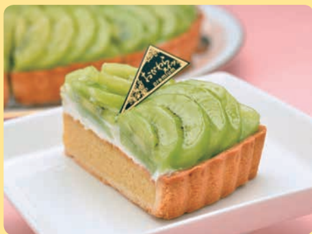
季節の果実のタルト