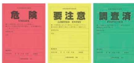
応急危険度判定の結果を示す標識

この判定作業を行うのが「応急危険度判定士」で、約40人の市職員がこの資格を持っています。