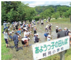
小学生と地域で行う米づくり

地区の人口約1100人。子育て支援、福祉、環境整備など、幅広く活動しています。今年度は、地区の将来展望を示す長期計画を策定します。