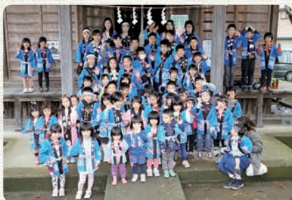
大勢の子どもが参加

で、環境美化はもちろん、地域住民の交流の場として定着することが目標です。これから、他の活動にも取り組んでいきたいと思っています。委員会は立ち上がって間もないですが、地域のために無理をせず、楽しく長く続けていきたいと思っています。