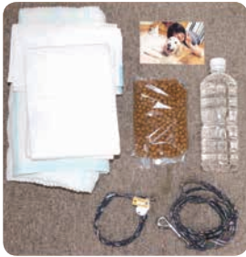
ペット用の避難グッズ