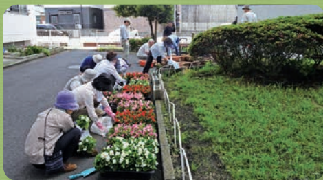
足柄地区いっせい清掃 (セントラルハイツ)