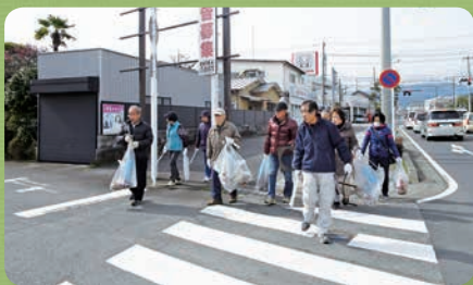
足柄地区いっせい清掃 (第37区)

最初は各自治会とも数人の参加でしたが、活動は徐々に広まり、散歩をしながらゴミを拾うなど、地域住民に環境美化の意識が根つきつつあります。また、すれ違う住民に挨拶する人や、地域について情報交換する人なども増え、住民同士のコミュニケーションが活発化し、清掃活動を通じて安心・安全なまちづくりを進めています。