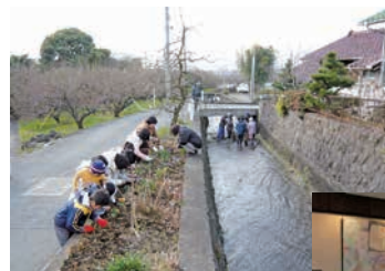
清掃活動のようす

内の道路、山道、河川を清掃しています。モットーは「自分の町は、自分の手から」。毎年数十万人が訪れる「梅まつり」の前には、地域内の一斉清掃も行っています。 こうした活動が地域内の環境美化に貢献しているとともに、地域住民の環境美化意識の向上に寄与していると認められ、表彰されました。