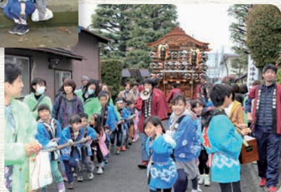
山車を引いて区内へ