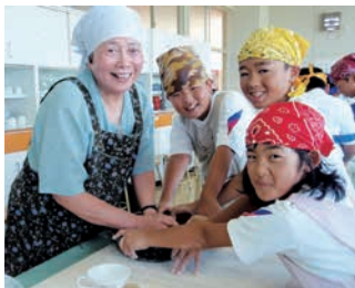
介護予防・生涯学習の事業

全世帯が加入するNPO法人で、合意形成、ひとづくり、資金づくりのシステムに独自の手法を取り入れています。