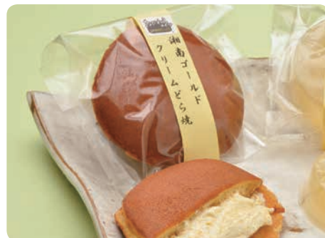
湘南ゴールドクリームどら焼 御菓子処 盛月(板橋648) ☎22-3860

J Aかながわ西湘の「朝トレファクミト」から、その日最高の果物を仕入れ、スイーツを創作しています。素材のよさだけでなく、熟度や糖度を見極め、クリームの滑らかさやタルト生地への焦かし方にもこだわっています。 開店からまだ1年、路地裏にある店舗なので、知名度を高めることが課題ですが、最近では東京方面からこの店を目指して来てくれる人も増えています。市外から小田原に人を呼べる店になれば、小田原を盛り上げることに繋がりますね。