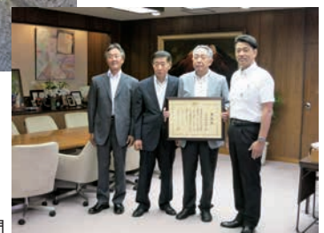
市長への表敬訪問