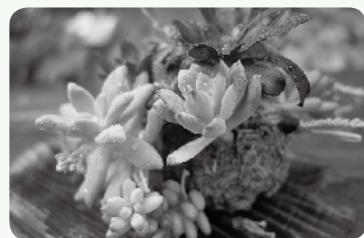
▲ボールオーナメント