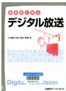
『体系的に学ぶデジタル放送』 神崎 洋治／著 西井 美鷹／著 日経BPソフトプレス

デジタル放送を視聴・録画するために必要な機器や設備、送受信のしくみ、使用されている技術、パソコンでの利用法まで、デジタル放送のすべてを体系的に解説。