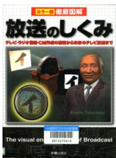
『放送のしくみ』 テレビ・ラジオ番組・CM作成の 秘密から未来のテレビ放送まで』 トリプルウイン／著 新星出版社

デジタル放送を視聴・録画するために必要な機器や設備、送受信のしくみ、使用されている技術、パソコンでの利用法まで、デジタル放送のすべてを体系的に解説。