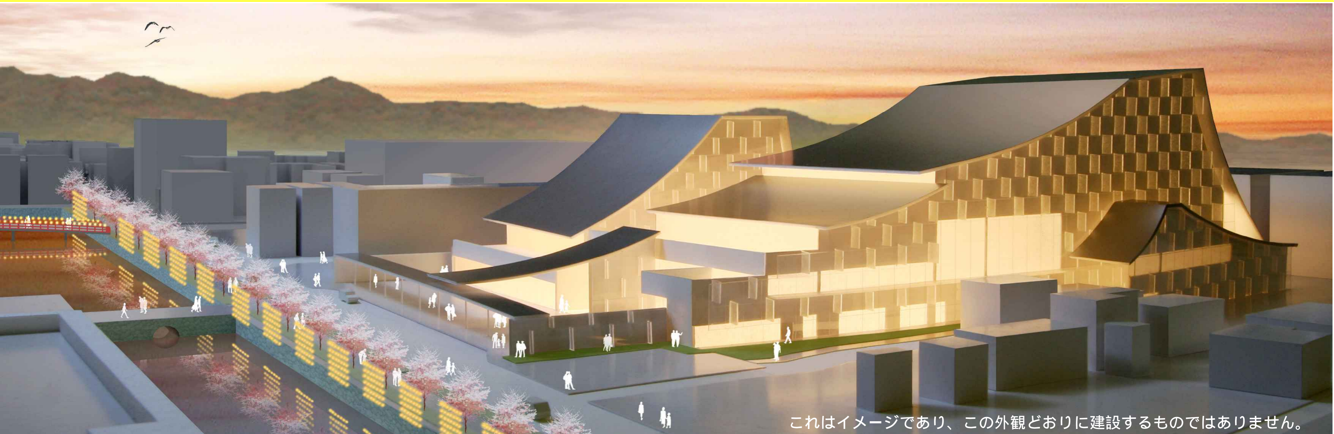
これはイメージであり、この外観どおりに建設するものではありません。