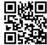
その他（スマートフォン等）

« 問い合わせ先 » 〒250-8555 神奈川県小田原市荻窪300番地 小田原市役所 企画部 職員課 人事研修係（3階・赤通路） 電話 0465（33）1241 ホームページ http://www.city.odawara.kanagawa.jp/saiyou.html