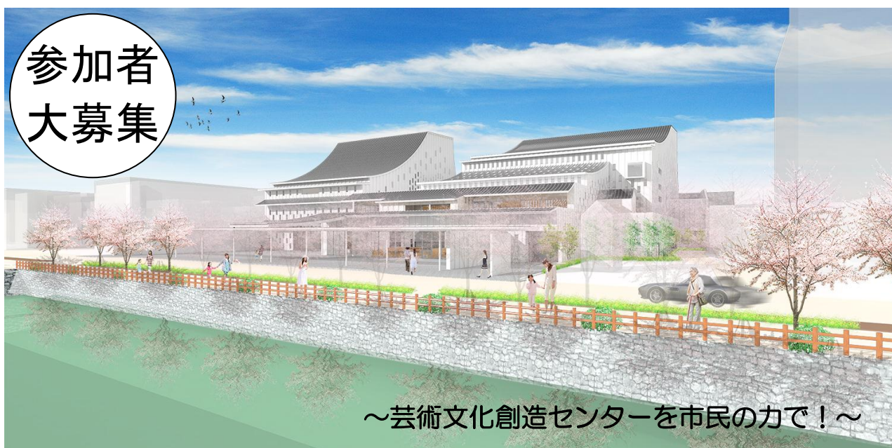
外観イメージ ※実際とは異なる場合があります。