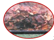
ここにかめがいます！

登園時に子ども達と挨拶をしていると、天気の良い日には真っ白に雪化粧した富士山が目に入ってきます。夏から冬へ富士山の景色で季節の移り変わりを感じています。また、園庭の木々の葉も色づき、特に赤や黄色に色付いた葉を子ども達が手に取り集めています。餌を食べなくなったカメのここちゃん・リボンちゃんは11月末には冬眠に入りました。冬眠という言葉は難しいようで、「冬の間は葉っぱの布団の中で眠るんだよ！」と話しています。世話をしていた年長児が葉っぱを入れたり、水をかけたりして冬眠をさせてくれました。