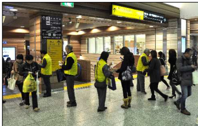
統一地方選挙の街頭啓発をアークロードで実施