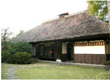
岩瀬家住宅主屋（岩瀬邸）

「国登録有形文化財」や「小田原ゆかりの優れた建造物」に登録・認定された文化財建造物ほかを一般公開します。はガイド協会員により随時、は11時と14時に施設の職員による説明があります。事前の申し込みは必要ありません。