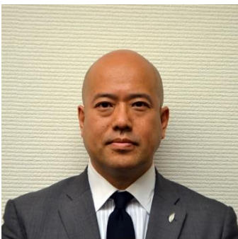
報徳二宮神社 宮司

1982年東京生まれ。早稲田大学高等学院在学中の2000年に全国商店街合同出資会社の社長就任。早稲田大学政治経済学部政治学科卒業後、一橋大学大学院商学研究科修士課程へ進学。08年、熊本城東マネジメント株式会社設立、09年一般社団法人エリア・イノベーション・アライアンスを設立。内閣官房地域活性化伝道師や各種政府委員も務める。主著に「地方創生大全」(東洋経済新報社)、「稼ぐまちが地方を変える」(NHK新書)、「まちで闘う方法論」(学芸出版)、「まちづくりの経営力養成講座」(学陽書房)がある。