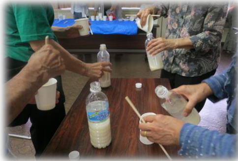
えひめ AI 作り

「小田原生ごみクラブ」とは、小田原市生ごみ堆肥化事業を支える市民団体です。クラブでは「生ごみサロン」を企画・運営しています。生ごみ堆肥化に興味のあるかたや段ボールコンポストなど生ごみ堆肥化を行っているかたの集いの場です。情報交換や疑問の解消にも役立ちますので、お気軽にご参加ください。