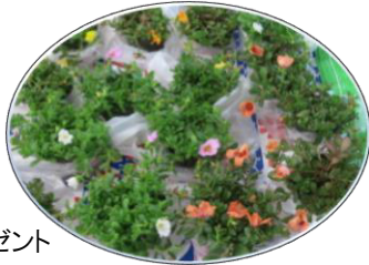
苗・種プレゼント

ぜひ、ご家庭でも作ってみてください！ 各会場では、生ごみ堆肥化に関する悩みごと相談や情報交換が活発に行われ、また、花や野菜の苗、種等のプレゼントもありました。 参加いただいた皆さま、どうもありがとうございました。次回のサロンもお楽しみに♪