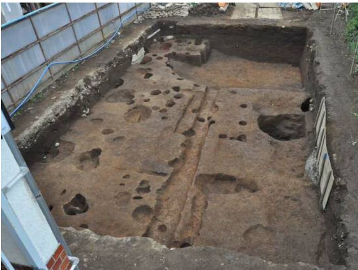
酒匂北川端遺跡第Ⅷ地点