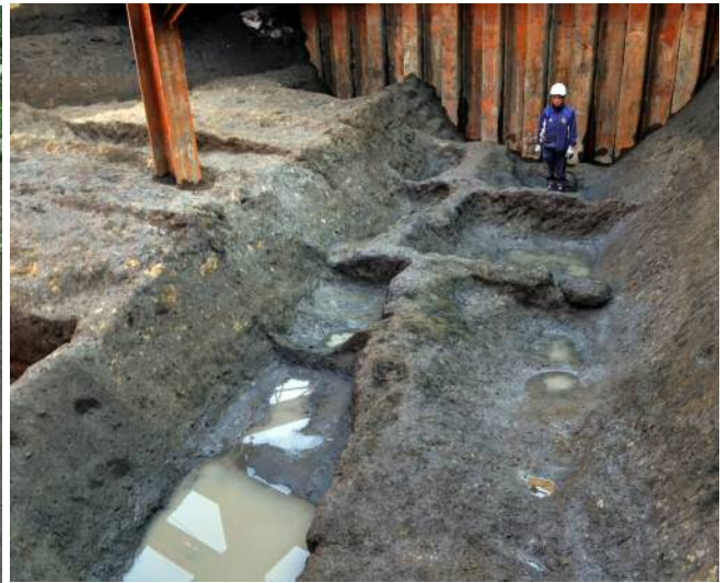
小田原城三の丸元蔵堀第Ⅱ地点