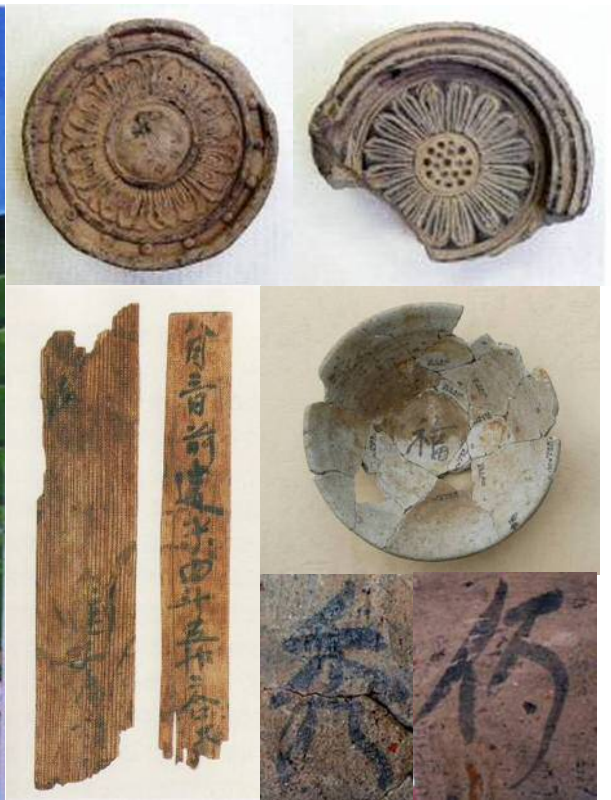
千代周辺で見つかった瓦や木簡、墨書土器