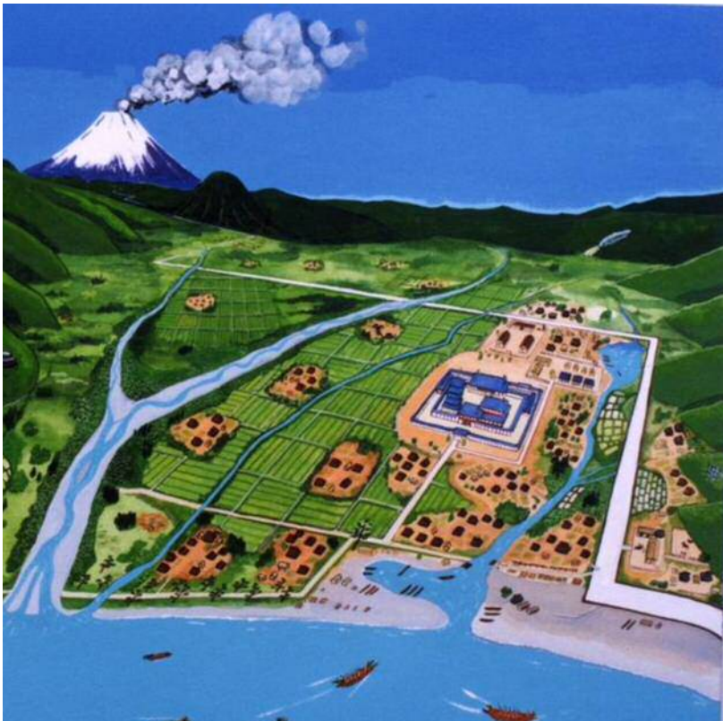
当時の千代寺院跡周辺のイメージ（さかいひろこ画）