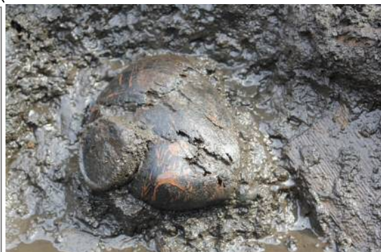
別堀前田遺跡第Ⅴ地点