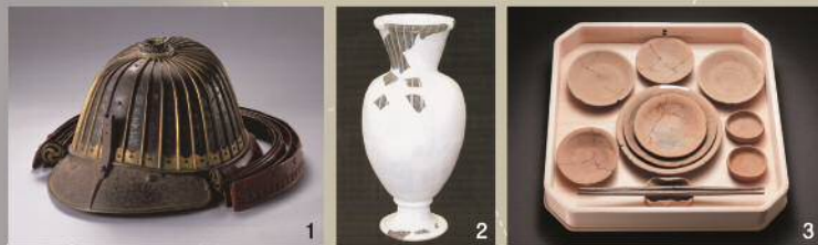
写真1 三十二間筋兜(北条氏邦奉納) 写真2 八王子城出土レースガラス瓶 写真3 小田原産の京都系かわらけ

各地で大切に保管されてきた資料が、今回の展示を通じて小田原城天守閣で一堂に会することで、資料所有者の方々や展示を御覧になる多くの皆様と小田原北条氏を介した新たな「絆」が構築できれば幸いです。