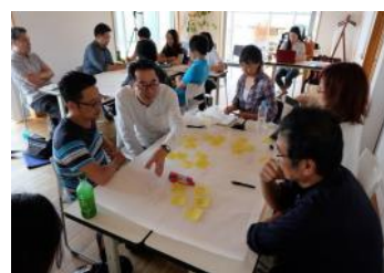
セッションの様子

相模湾・三浦半島アートリンクのメンバーと一緒に、午前中に見学した文化資源などを参考に、アートによる文化資源の活用など様々なアートの可能性について話し合います。