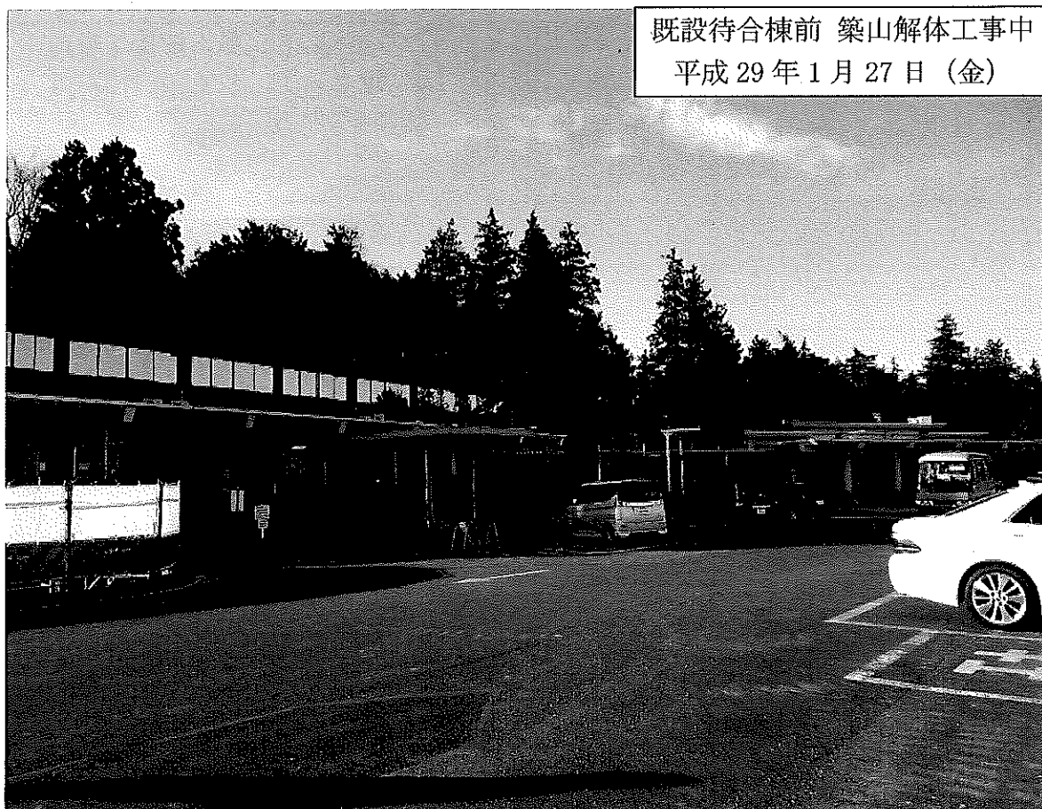
既設待合棟前 築山解体工事中 平成 29 年 1 月 27 日 (金)