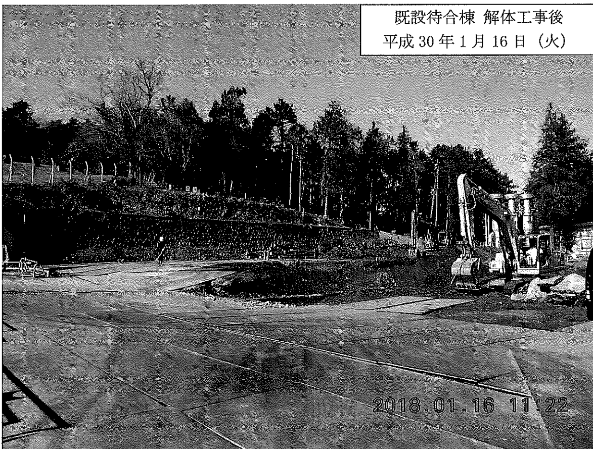
既設待合棟 解体工事後 平成 30 年 1 月 16 日 (火)