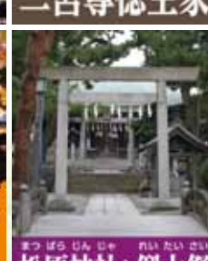
松原神社と例大祭