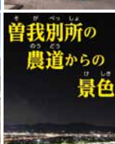
曾我別所の 農道からの 景色