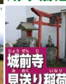
城前寺 見送り稲荷