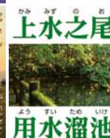
上水之尾 用水溜池