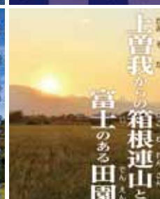
上曾我からの箱根連山と 富士のある田園