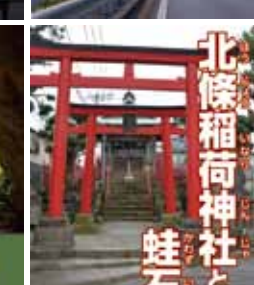
北條稲荷神社と 蛙石