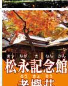
松永記念館 老樗荘