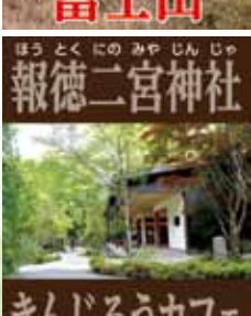
報徳二宮神社 きんじろうカフェ