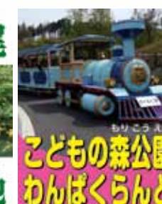
こどもの森公園 わんぱくらんど