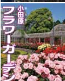
フラワーガーデン