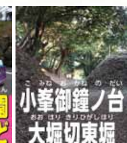
小峯御鐘ノ台 大堀切東堀