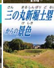
三の丸新堀土塁 からの景色