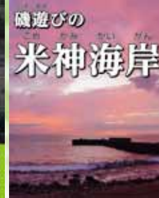
磯遊びの 米神海岸