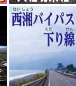
西湘バイパス 下り線