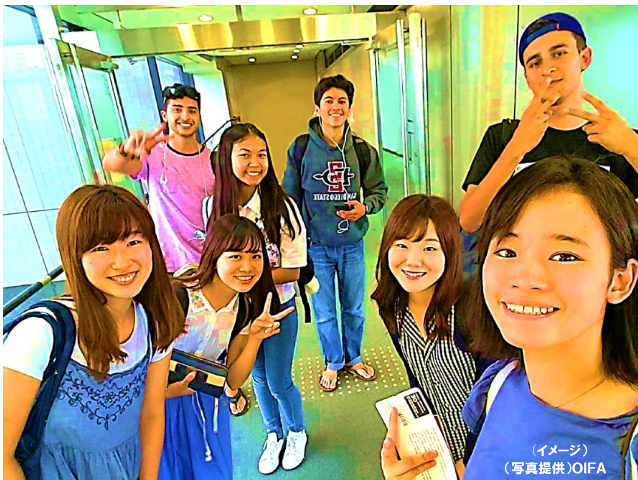
(イメージ)