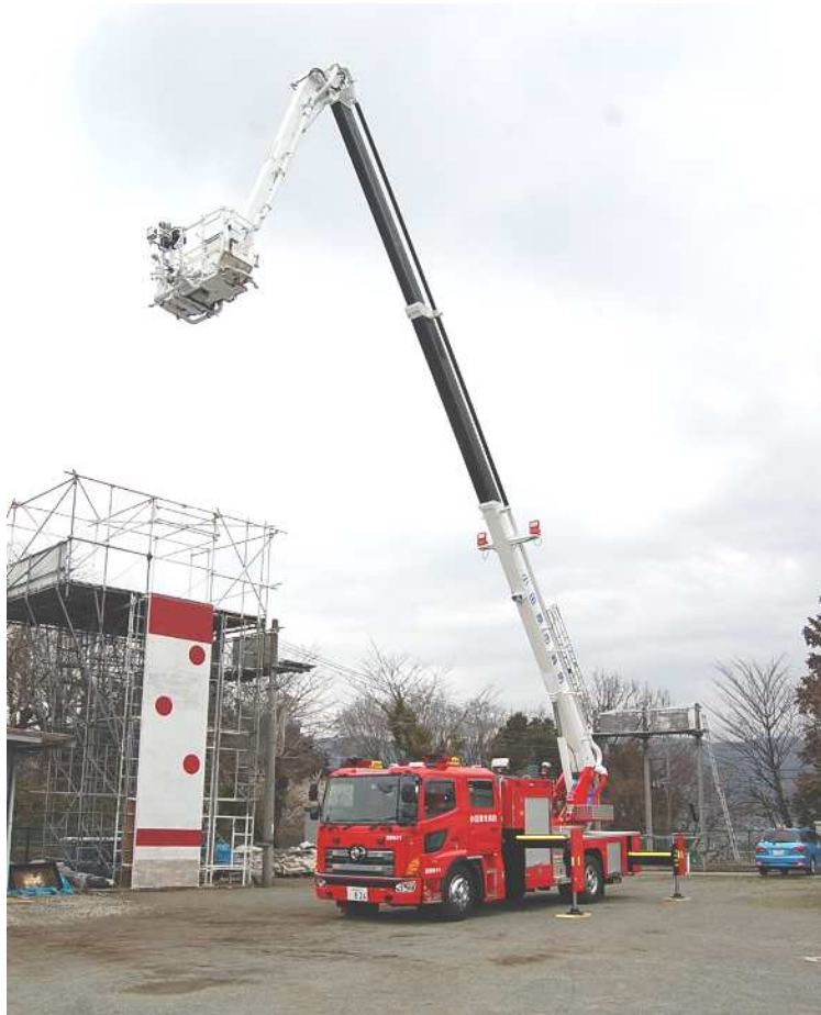
屈折はしご自動車（足柄梯子1）