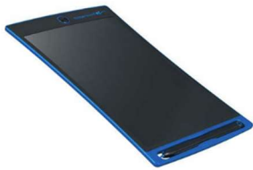
電子式筆談ボード