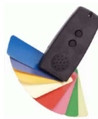
音声色彩判別装置