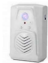
センサー付き音声案内機