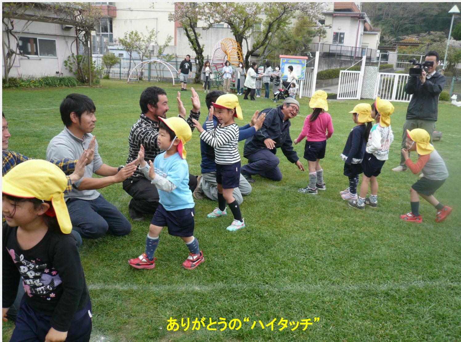
ありがとうの“ハイタッチ”