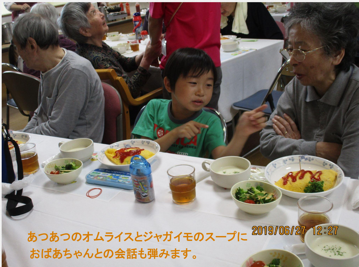
あつあつのオムライスとジャガイモのスープに 2019/06/27 12:27 おばあちゃんとの会話も弾みます。