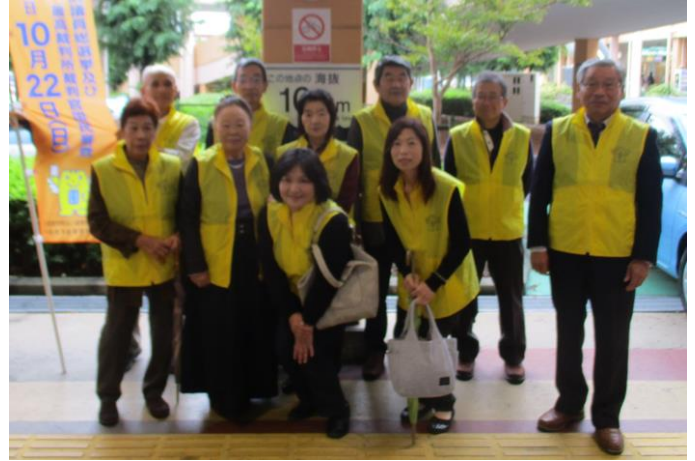
衆議院議員総選挙及び最高裁判所裁判官国民審査の街頭啓発をフレスポ小田原シティモールで実施