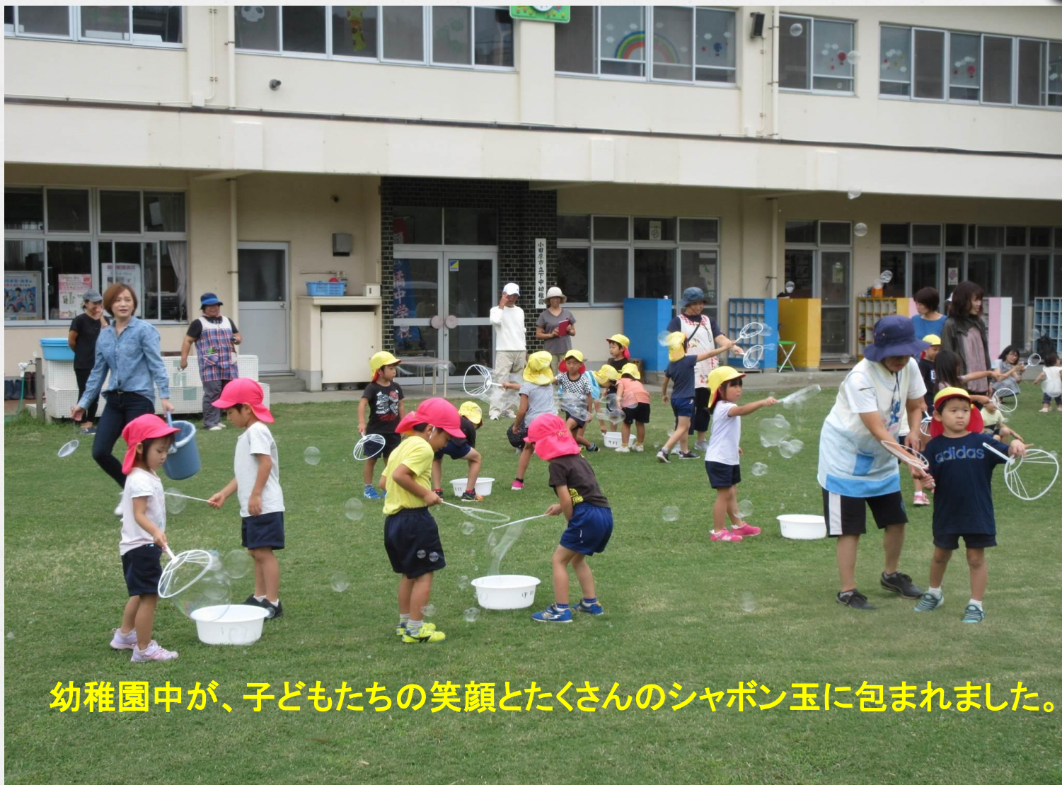
幼稚園中が、子どもたちの笑顔とたくさんのシャボン玉に包まれました。