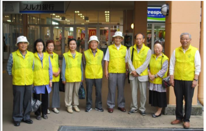
参議院議員通常選挙の街頭啓発をフレスポ小田原シティモールで実施