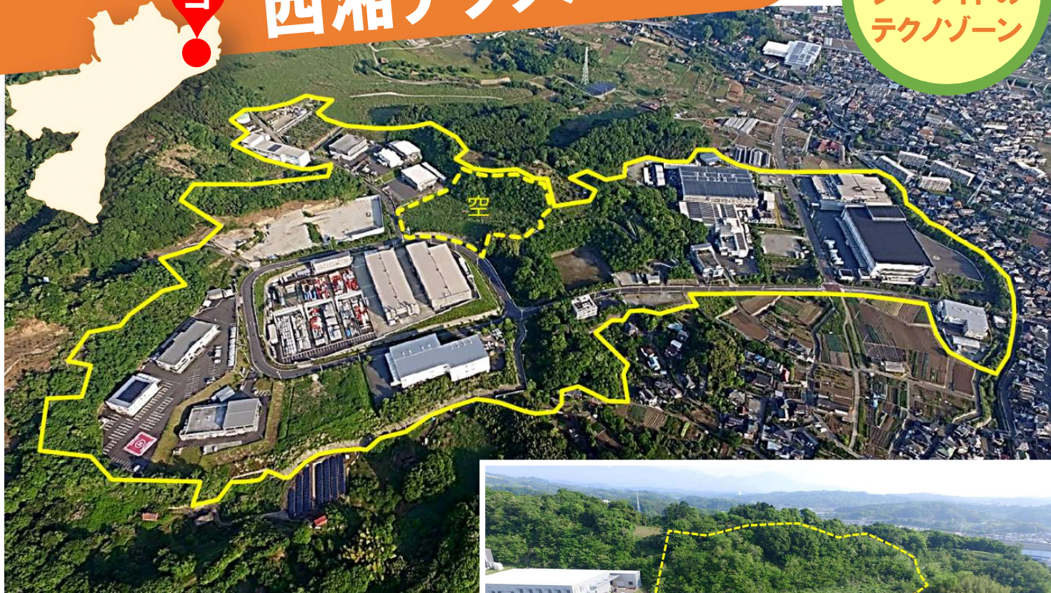
上/全体、右/分譲中のG-4区画。平成29(2017)年5月撮影