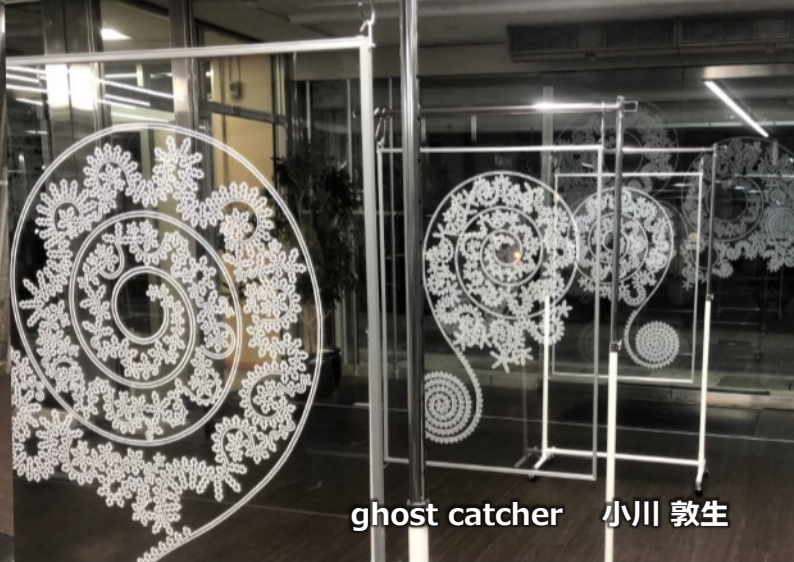
ghost catcher 小川 敦生