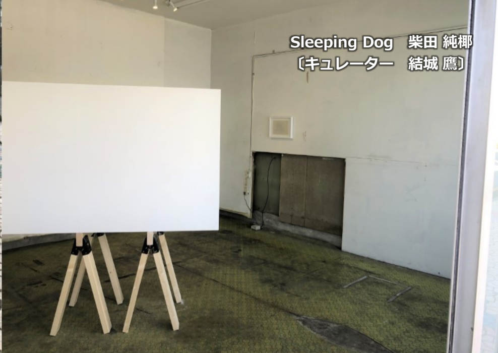
Sleeping Dog 柴田 純椰 〔キュレーター 結城 鷹〕