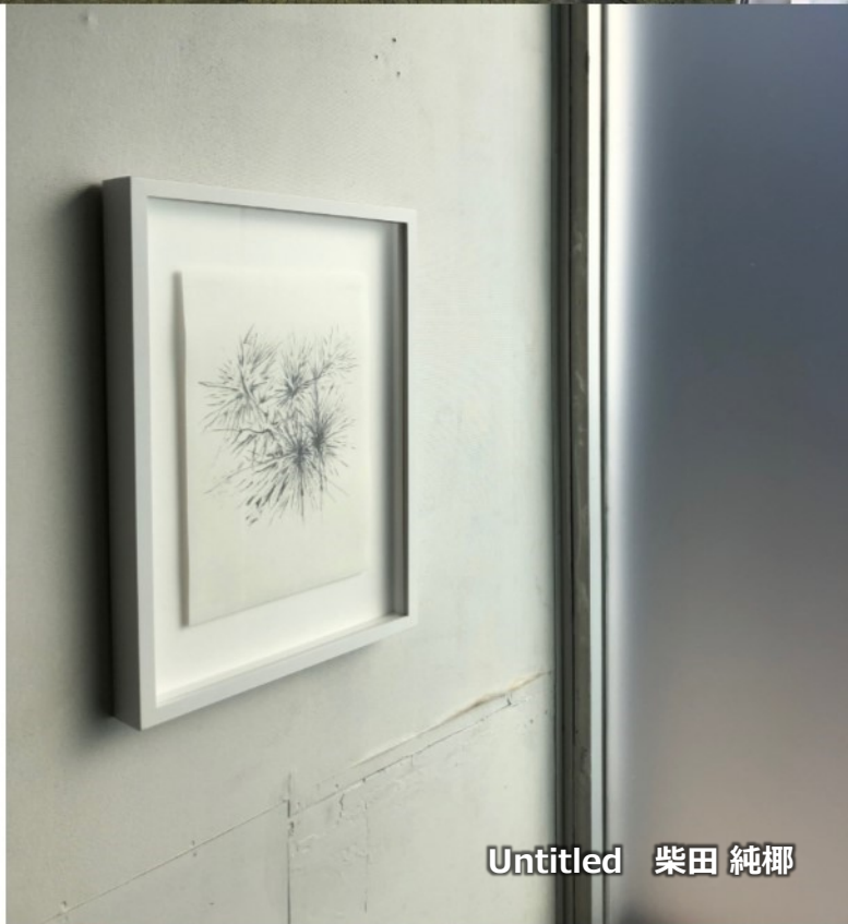
Untitled 柴田 純椰