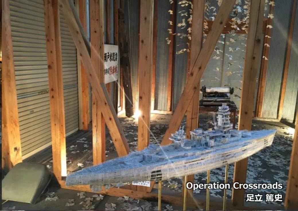
Operation Crossroads 足立 篤史