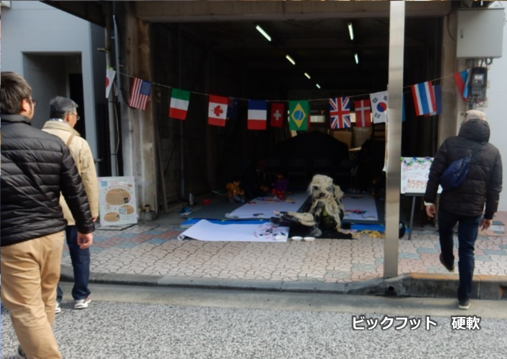
ビックフット 硬軟