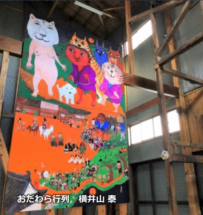
おだわら行列 横井山 泰