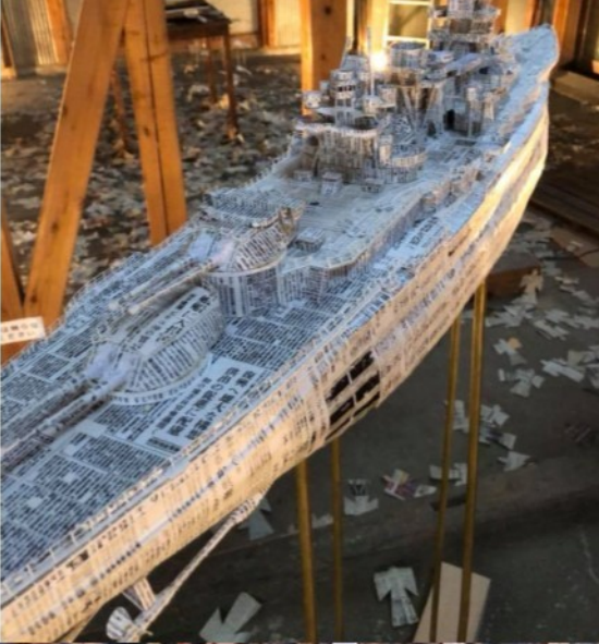
旧瀬戸たばこ店×現代アート展 「道行 ーみちきー」 足立篤史