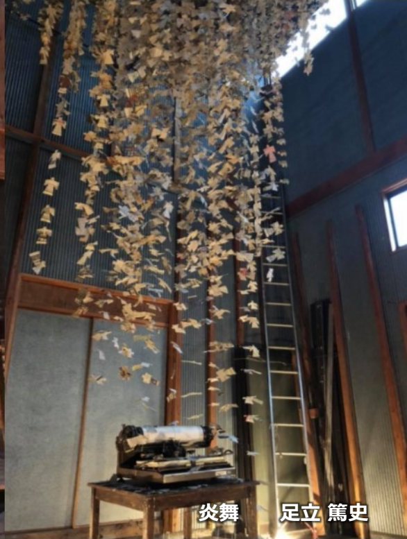
炎舞 足立 篤史