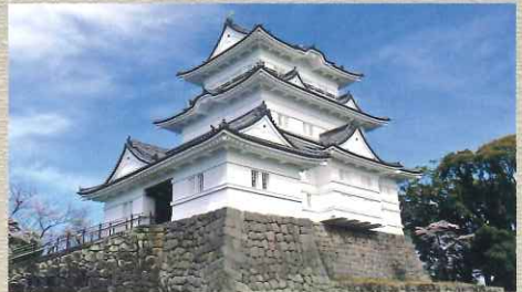
小田原城天守閣 石垣からの高さは27.2mで全国7位の高さを誇る。最上階からは市街地や相模湾などを一望できる。