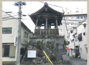
大手門跡 東の出入口であった門跡地には現在「時鐘堂」があり、一日2回市民に時刻を知らせている。