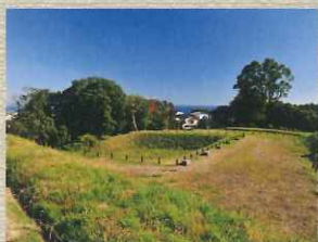
さんのまるがいかくしんぼりどるい 三の丸外郭新掘土塁 三の丸外郭と総構の結節点にあたる重要な場所。眺望にも優れていて相模湾や石垣山城が一望できる。