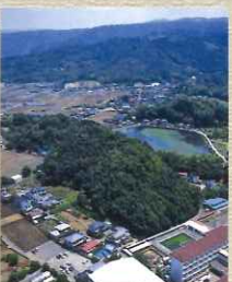
葦山城址。(静岡県伊豆の国市)

(静岡県伊豆の国市) 堀越御所を攻め落とし、早雲が築き生涯の居城としたのが葦山城。伊豆の国市にある。永正16年8月15日、葦山城で死亡した。