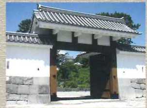
馬出門 馬屋曲輪へ通じる門。城外へ城主や城兵が出る時の門であることからこの名で呼ばれる。