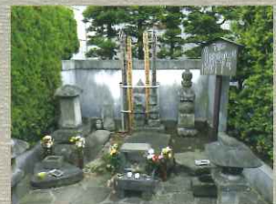
北条氏政・氏照の墓所 四代氏政とその弟氏照の墓所。今はたくさんの幸せの鈴が願掛けでかけられている。