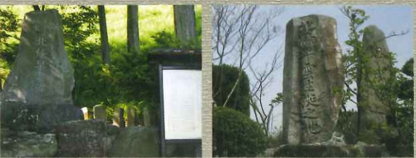
北条早雲誕生の地、にある高越城跡。(岡山県井原市) 家督争いを鎮めた功績によって与えられた興国寺城跡。(静岡県沼津市)