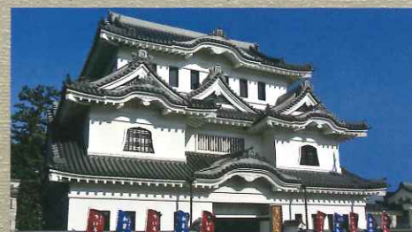
東海道名物ういろうの店舗。お城の様な独特の店舗も外郎家の伝統の一つ。