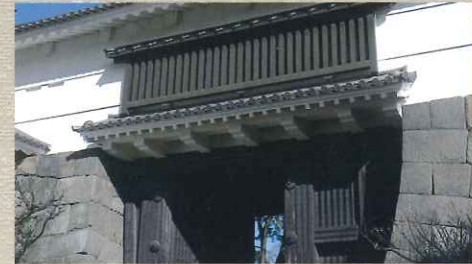
常盤木門 小田原城本丸の正門。元禄16年の大地震で崩壊した後、再建された。昭和41年に完成。