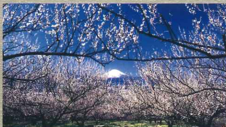
曾我梅林は富士山を背景にして約3万5千本の白梅が咲き誇る。

小田原の海沿い、片浦地区。この地区で作られているレモンは、海の風と温かい日差しの降り注ぐ斜面で育ち、ワックス、防カビ剤不使用。そんな「安全・安心な国産レモン」を使用した様々な小田原名産が生まれている。サイダーや生ようかんなどが人気。