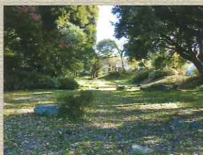
早川口遺構 現在低地部で見える事の出来ない虎口跡のひとつ。