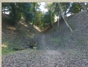
こみねおかのねのだいおほほりきりむがしほり 小峯御鐘ノ台大堀切東堀 小田原城の防衛機能をより堅固なものとして作られたもので、雄大な空堀と土塁が残る。