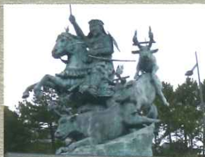
北条早雲公像 北条早雲のブロンズ像。像の高さは5.7m、重さは7トンある。