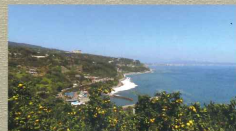
レモンやみかんなど豊富な種類の柑橘類が収穫できる片浦。もちろん目の前の相模湾では海の幸も。