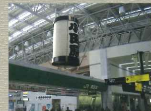
小田原駅 神奈川県西部のターミナル駅であり、箱根観光の拠点ともなっている。