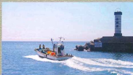
豊富な魚介類が水揚げされる小田原漁港。名産の干物やかまぼこは月2回開催される港の朝市でも購入可能。