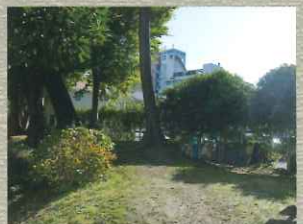
幸田口門跡 三の丸への北の出入り口となっていた幸田門の跡地。現在も当時の土塁を見る事が出来る。

明治3年に廃城となり、大正12年の関東大震災では壊滅的な被害を受け、一部の堀などは埋め立てられた。小田原城は、昭和13年以降6次にわたって国の史跡として指定され、昭和35年には耐震改修及び資料展示の初となるリニューアルを施した。