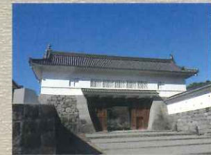
銅門 二の丸の正門にあたる。扉の飾鉄に銅が用いられたことがその名の由来と考えられている。