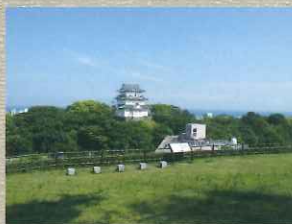
はちまんやまこかくひがしくわ 八幡山古郭東曲輪 ここに三代氏康が鎌倉八幡宮を分祀したとも言われている。