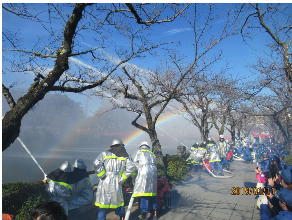
消防出初式一斉放水