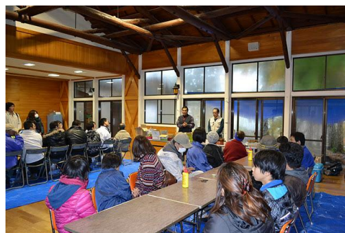
【12月 3日 開会・森林インストラクター紹介】