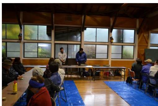
【12月 3日 開会・あいさつ】