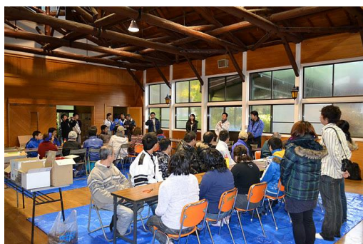
【12月 3日 開会・あいさつ】