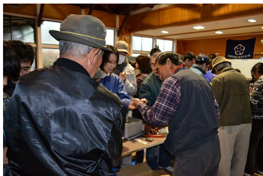
【12月 3日 木工体験バードコール説明】