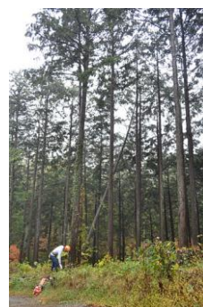
【12月 3日 間伐演示】