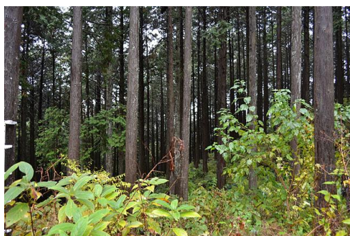
【12月 3日 間伐演示】