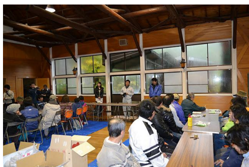
【12月 3日 開会・あいさつ】