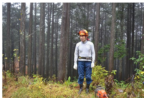
【12月 3日 間伐体験“森の専門家”実演】