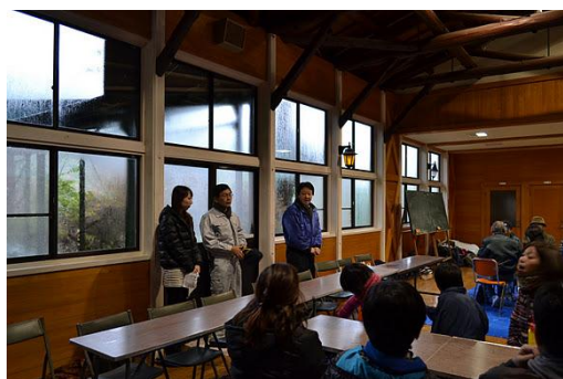
【12月 3日 開会・あいさつ】