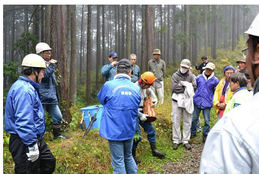
【12月 3日 間伐体験“森の専門家”実演】