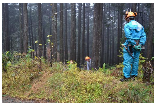
【12月 3日 間伐体験“森の専門家”実演】