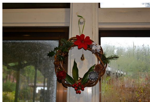
【12月 3日 木工体験クリスマスリース完成】