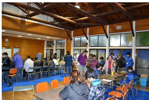
【12月 3日 木工体験クリスマスリース作成】