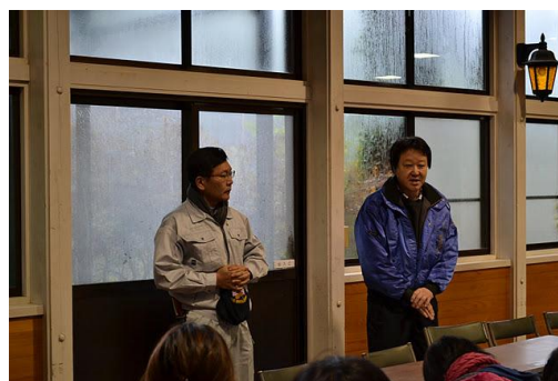
【12月 3日 開会・あいさつ】