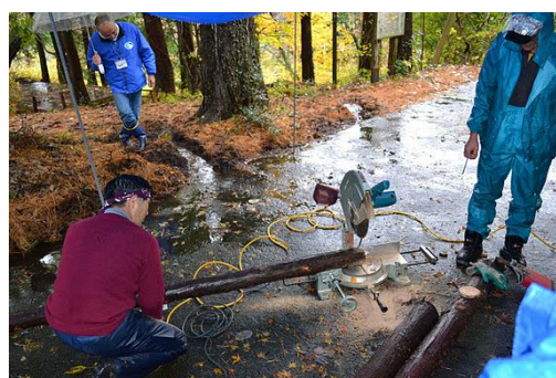
【12月 3日 木工体験コースターづくり】