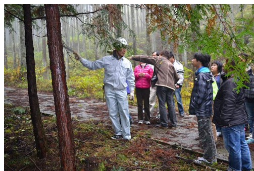
【12月 3日 間伐体験予定地での説明】