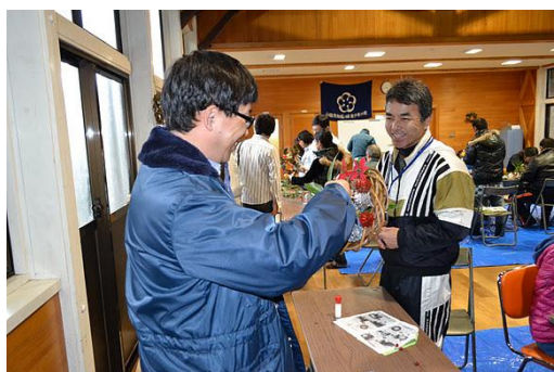
【12月 3日 木工体験クリスマスリース作成】