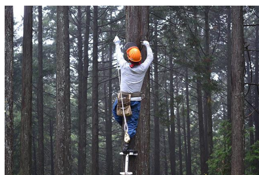
【12月 3日 間伐体験“森の専門家”実演】