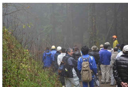
【12月 3日 間伐体験“森の専門家”実演】