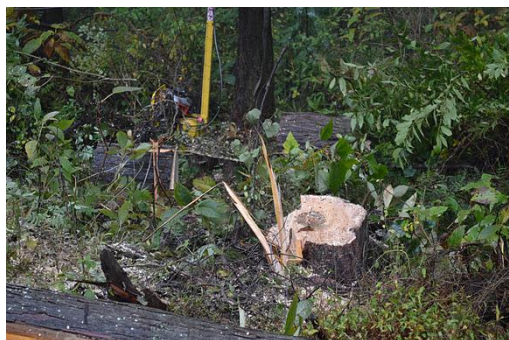
【12月 3日 間伐体験“森の専門家”実演】