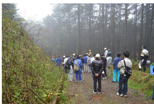
【12月 3日 間伐体験“森の専門家”実演】