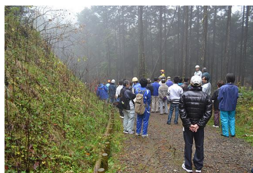
【12月 3日 間伐体験“森の専門家”実演】