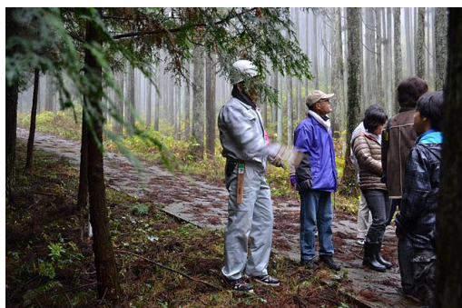
【12月 3日 間伐体験予定地での説明】