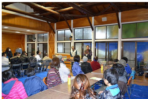
【12月 3日 開会・森林インストラクター紹介】