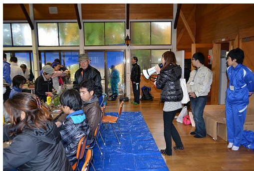
【12月 3日 木工体験クリスマスリース作成】