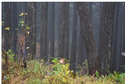
【12月 3日 間伐体験“森の専門家”実演】