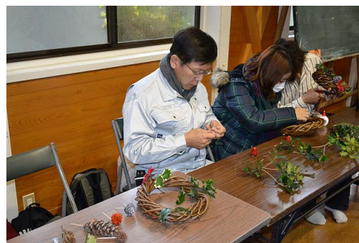
【12月 3日 木工体験クリスマスリース作成】