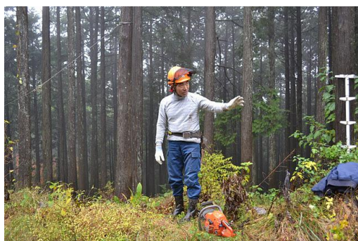
【12月 3日 間伐体験“森の専門家”実演】