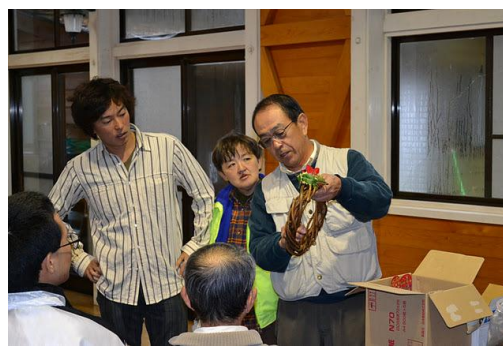
【12月 3日 木工体験クリスマスリース説明】