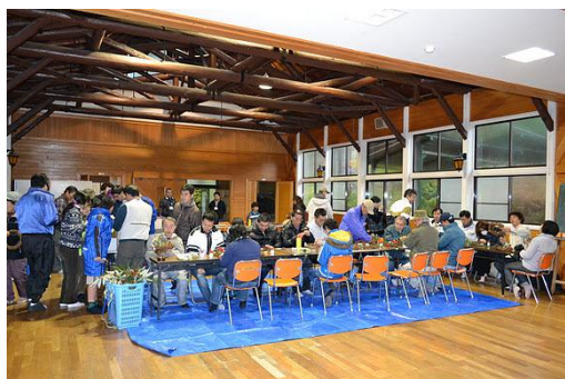
【12月 3日 木工体験クリスマスリース作成】