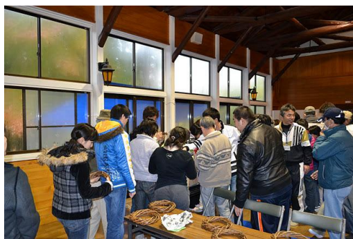
【12月 3日 木工体験バードコール説明】