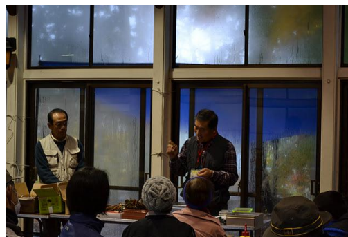
【12月 3日 開会・森林インストラクター紹介】