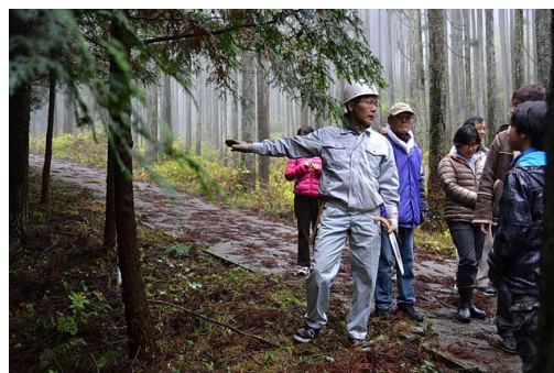
【12月 3日 間伐体験予定地での説明】