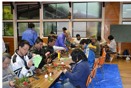
【12月 3日 木工体験クリスマスリース作成】