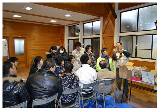
【12月 3日 木工体験クリスマスリース説明】