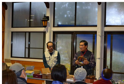
【12月 3日 開会・森林インストラクター紹介】