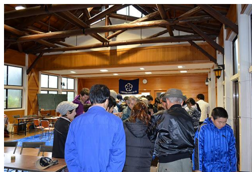
【12月 3日 木工体験バードコール説明】