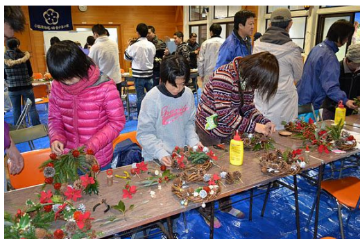
【12月 3日 木工体験クリスマスリース作成】