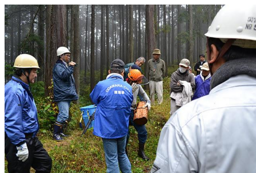
【12月 3日 間伐体験“森の専門家”実演】