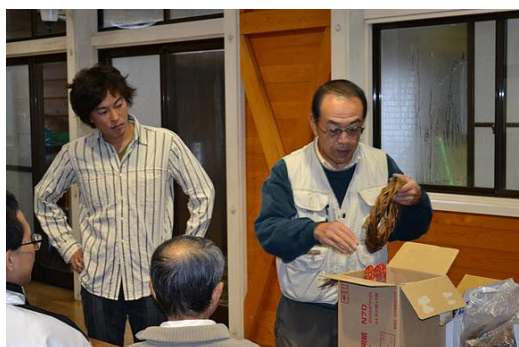
【12月 3日 木工体験クリスマスリース説明】