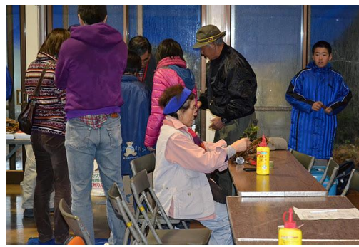
【12月 3日 木工体験バードコール作成】