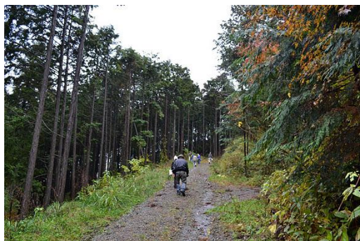
【12月 3日 間伐演示】