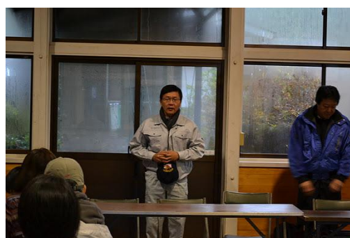
【12月 3日 開会・あいさつ】