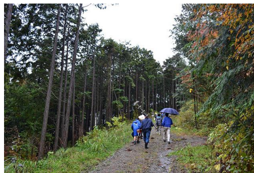
【12月 3日 間伐演示】