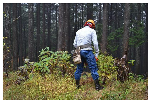
【12月 3日 間伐体験“森の専門家”実演】