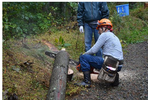
【12月 3日 間伐体験“森の専門家”実演】