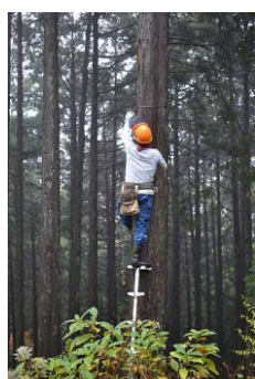
【12月 3日 間伐体験“森の専門家”実演】