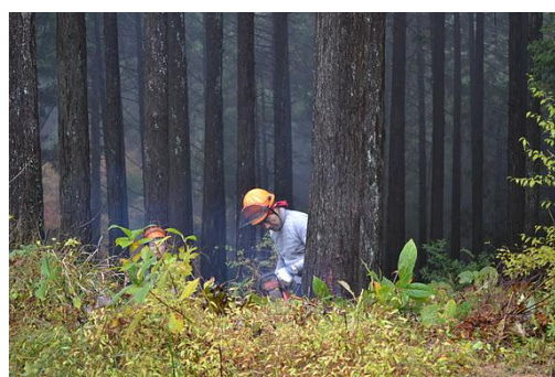
【12月 3日 間伐体験“森の専門家”実演】