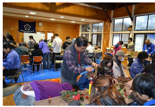
【12月 3日 木工体験クリスマスリース作成】