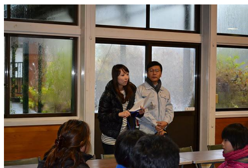
【12月 3日 開会・あいさつ】