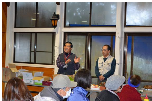
【12月 3日 開会・森林インストラクター紹介】