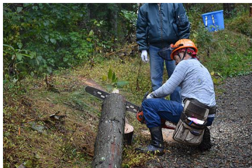
【12月 3日 間伐体験“森の専門家”実演】