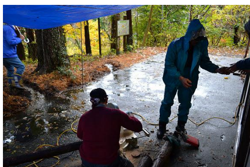
【12月 3日 木工体験コースターづくり】