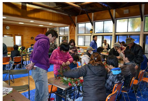
【12月 3日 木工体験クリスマスリース作成】