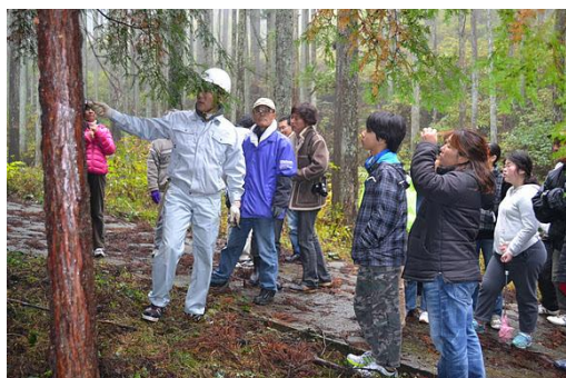
【12月 3日 間伐体験予定地での説明】