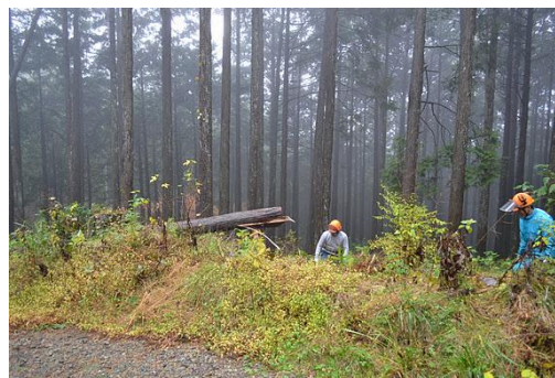
【12月 3日 間伐体験“森の専門家”実演】