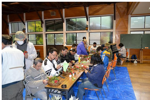
【12月 3日 木工体験クリスマスリース作成】