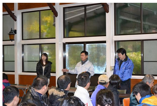
【12月 3日 開会・あいさつ】