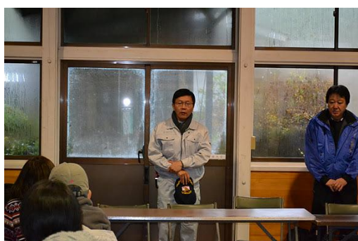
【12月 3日 開会・あいさつ】