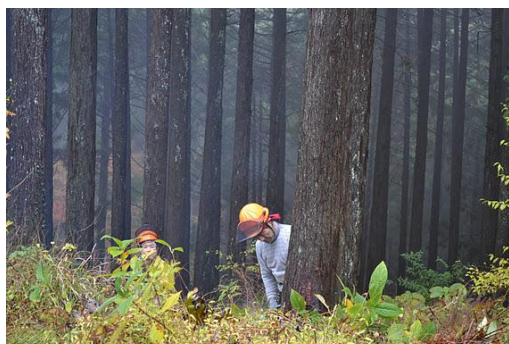
【12月 3日 間伐体験“森の専門家”実演】