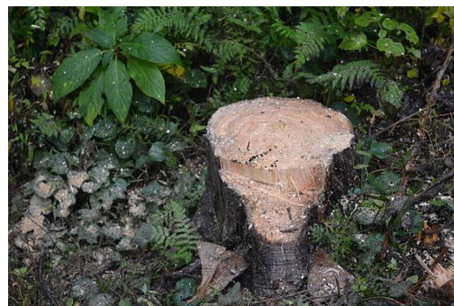
【12月 3日 間伐体験“森の専門家”実演】