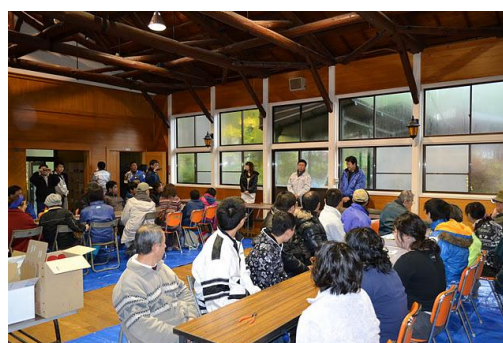
【12月 3日 開会・あいさつ】