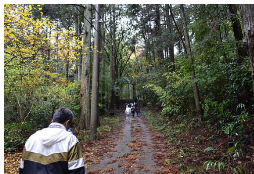
【12月 3日 間伐演示】