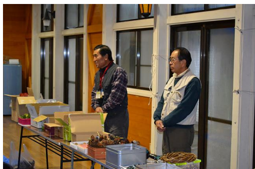
【12月 3日 開会・森林インストラクター紹介】