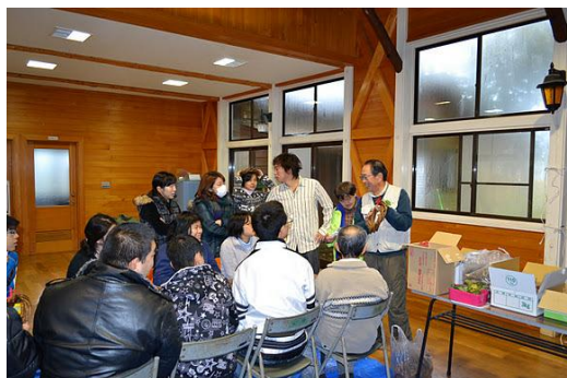
【12月 3日 木工体験クリスマスリース説明】