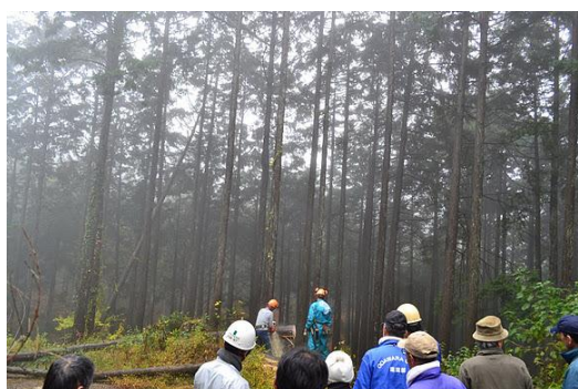
【12月 3日 間伐体験“森の専門家”実演】