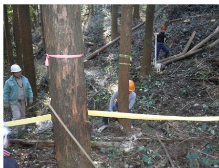
【12月16日 チェーンソーによる間伐演示】