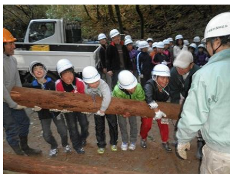
【12月16日 児童による材積み込み】