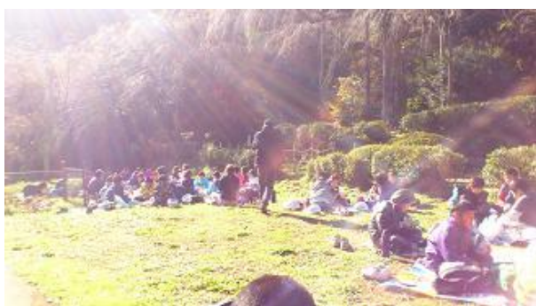
【12月16日 日当たりの良い場所での昼食】