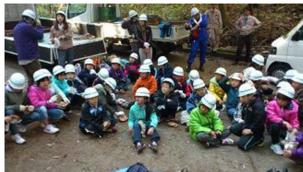
【12月16日 午前中の林内での作業終了】