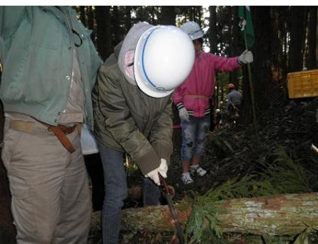
【12月16日 児童による玉切り実践】