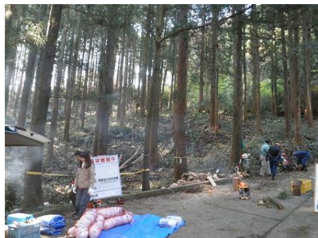
【12月16日 開会前準備中】