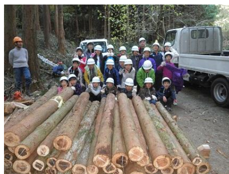
【12月16日 仕事の成果を前に記念撮影】