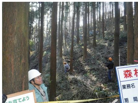
【12月16日 間伐演示を説明する組合職員】