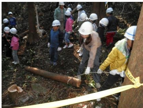
【12月16日 児童による林内材運び出し】