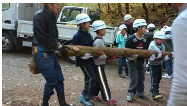
【12月16日 児童による材積み込み】