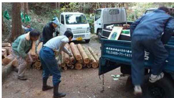
【12月16日 材の積み込み準備をする関係者】