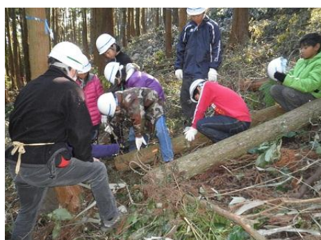
【12月16日 児童による玉切り実践】