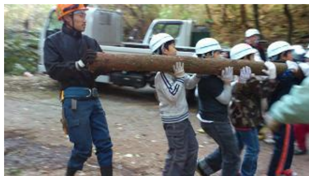
【12月16日 児童による材積み込み】