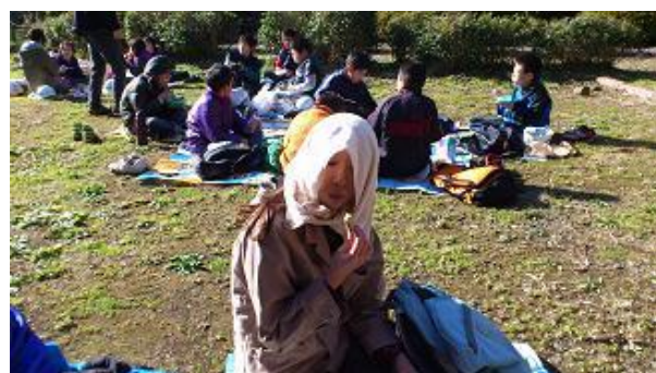
【12月16日 日当たりの良い場所での昼食】