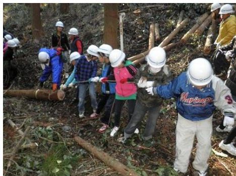
【12月16日 児童による林内材運び出し】