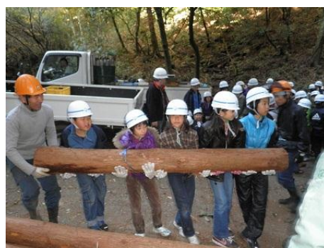
【12月16日 児童による材積み込み】