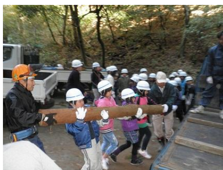
【12月16日 児童による材積み込み】