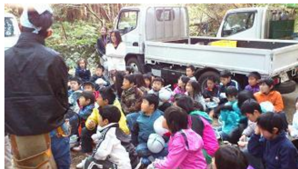
【12月16日 振り返り・反省会】