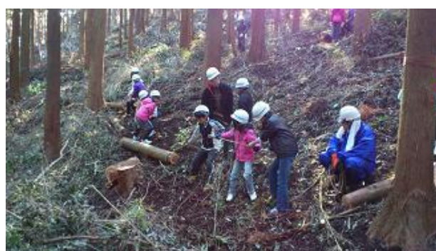
【12月16日 児童による材積み込み】