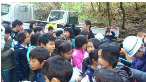
【12月16日 振り返り・反省会】