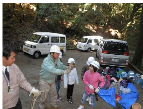
【12月16日 児童による林内材運び出し】