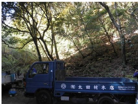
【12月16日 再生協議会メンバーも協力】