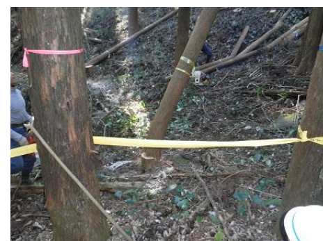
【12月16日 チェーンソーによる間伐演示】