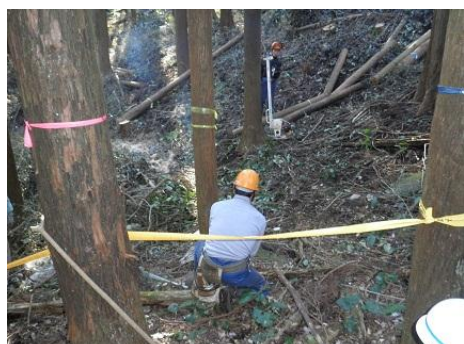
【12月16日 チェーンソーによる間伐演示】