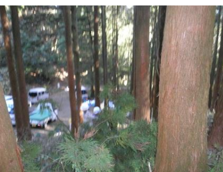
【12月16日 チェーンソーによる間伐演示】