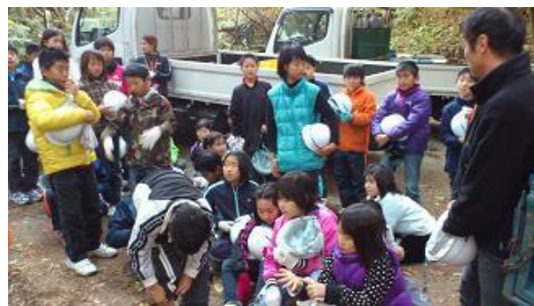
【12月16日 振り返り・反省会】