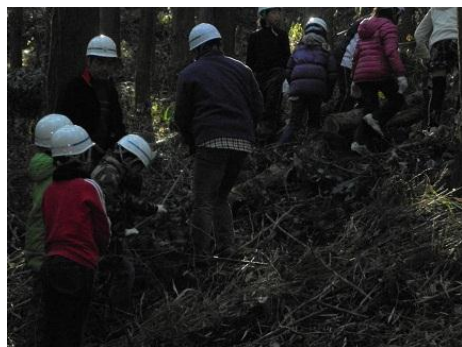
【12月16日 児童による林内材運び出し】