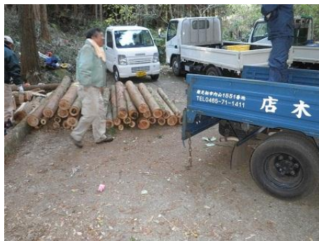
【12月16日 児童による材積み込みへ】