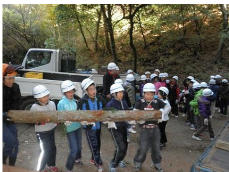
【12月16日 児童による材積み込み】