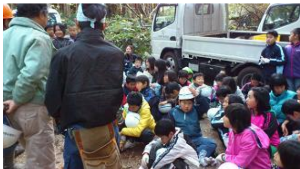
【12月16日 振り返り・反省会】