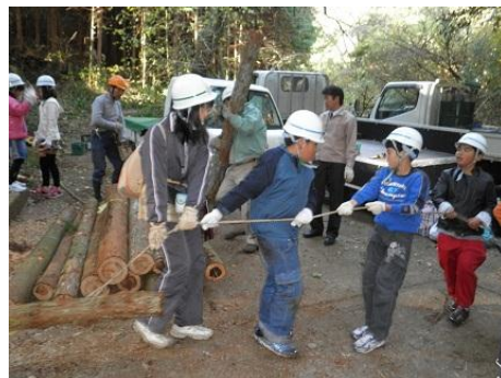
【12月16日 児童による林内材運び出し】