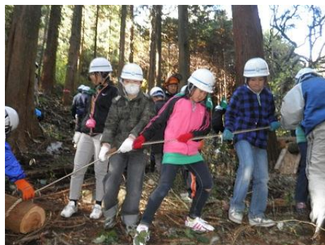
【12月16日 児童による林内材運び出し】