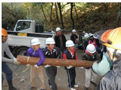
【12月16日 児童による材積み込み】