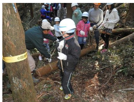
【12月16日 児童による林内材運び出し】