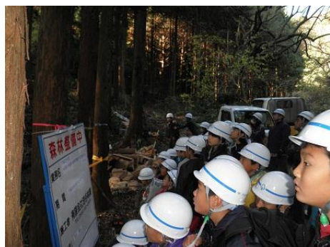
【12月16日 間伐演示に見る児童】