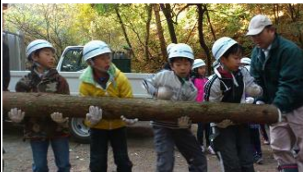
【12月16日 児童による材積み込み】