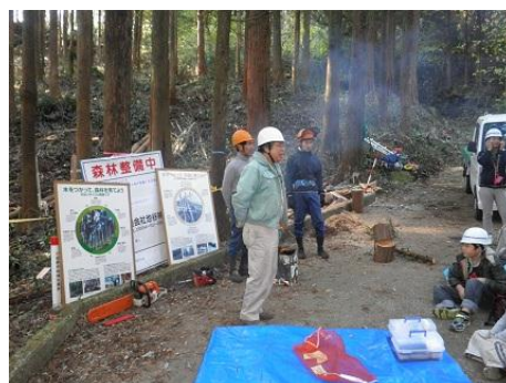
【12月16日 開会・あいさつ】