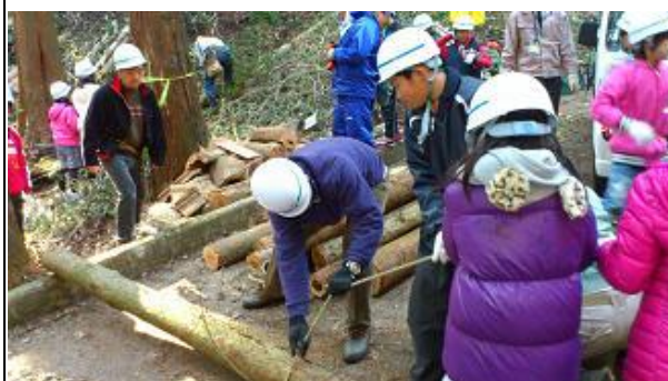
【12月16日 児童による材積み込み】