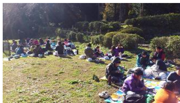
【12月16日 日当たりの良い場所での昼食】