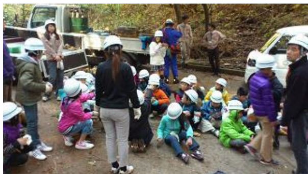
【12月16日 午前中の林内での作業終了】