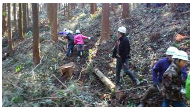
【12月16日 児童による材積み込み】