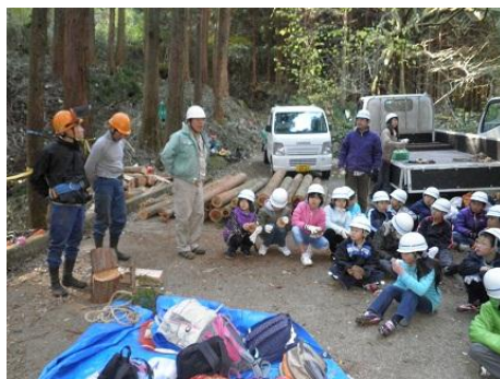
【12月16日 児童による林内材運び出し終了】