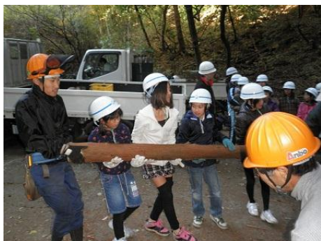
【12月16日 児童による材積み込み】