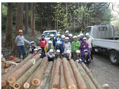
【12月16日 仕事の成果を前に記念撮影】