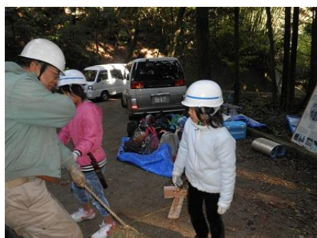
【12月16日 児童による林内材運び出し】