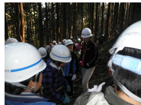
【12月16日 児童による玉切り実践】