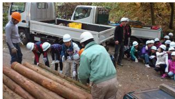
【12月16日 児童による材積み込み】