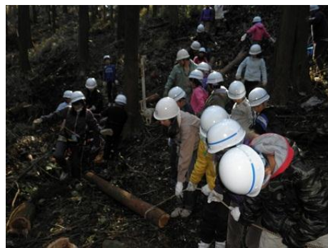
【12月16日 児童による林内材運び出し】