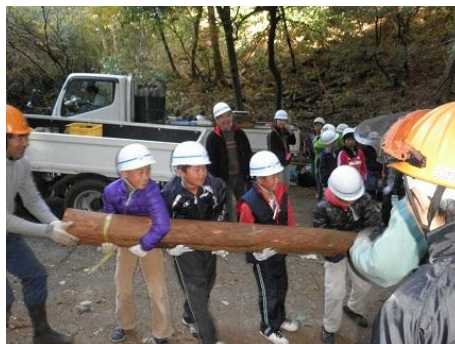
【12月16日 児童による材積み込み】