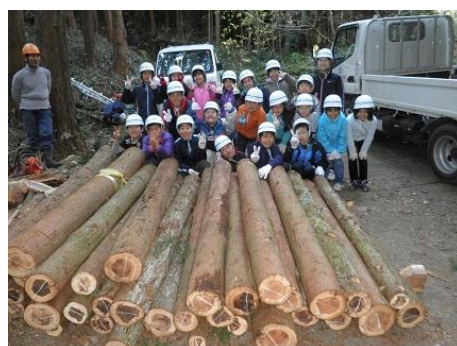
【12月16日 仕事の成果を前に記念撮影】