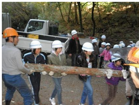
【12月16日 児童による材積み込み】