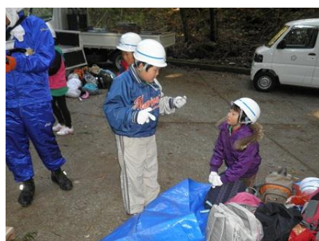
【12月16日 児童による玉切り実践】