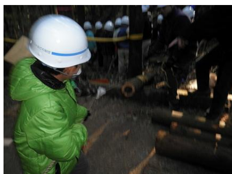
【12月16日 児童による林内材運び出し】