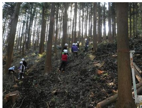
【12月16日 児童による林内材運び出し】