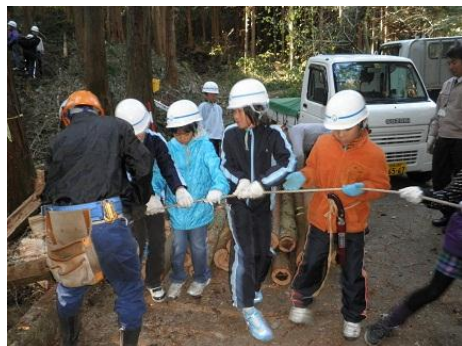
【12月16日 児童による林内材運び出し】