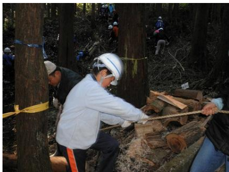
【12月16日 児童による林内材運び出し】