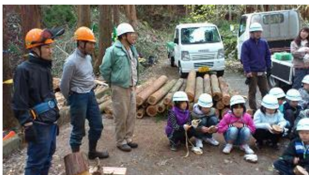
【12月16日 午前中の作業の振り返り】