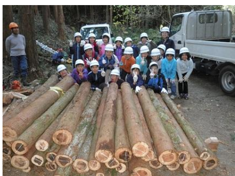
【12月16日 仕事の成果を前に記念撮影】