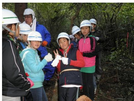
【12月16日 児童による玉切り実践】