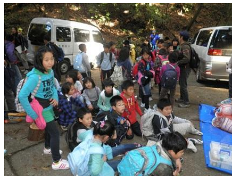
【12月16日 続々と児童が到着】