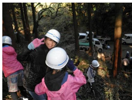
【12月16日 児童による玉切り実践】