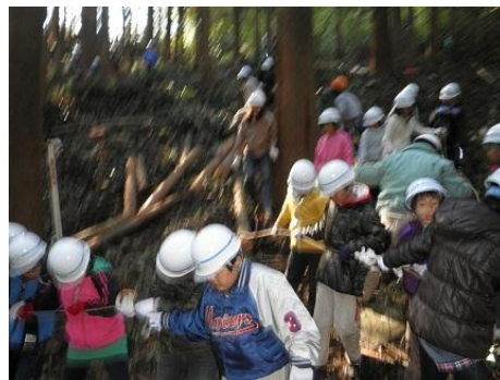
【12月16日 児童による林内材運び出し】