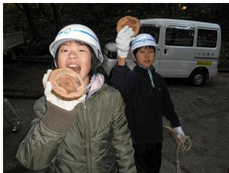
【12月16日 コースター用玉切り】