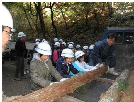
【12月16日 児童による材積み込み】