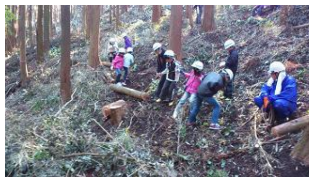
【12月16日 児童による材積み込み】