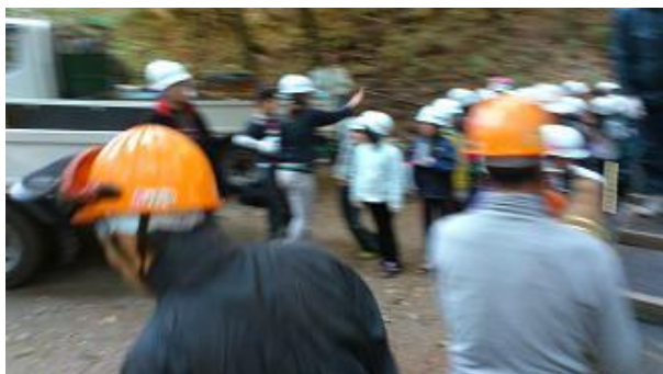
【12月16日 児童による材積み込み】