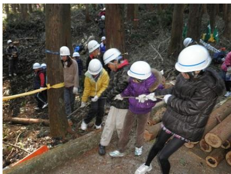
【12月16日 児童による林内材運び出し】