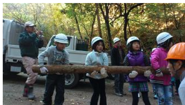
【12月16日 児童による材積み込み】