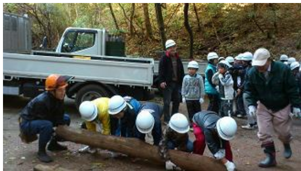
【12月16日 児童による材積み込み】