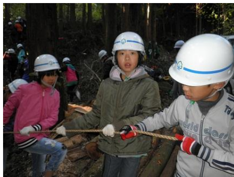
【12月16日 児童による林内材運び出し】