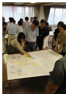
▲ワーキングの様子