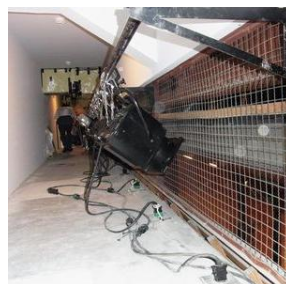
▲シーリングスポット室