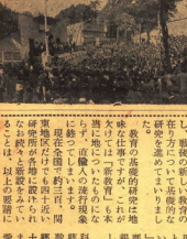
小田原市美術展の様子

五月十九日から五月二十二日まで、小田原市で美術展が開催された。この展覧会は、市内各団体の美術家による作品を展示するもので、市民の文化生活を豊かにするために開催された。展覧会には、絵画、彫刻、工芸などの作品が展示された。