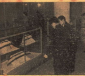
写真(上)文 化財展の一角 (左)延十文庫の一角

文化財とその保護に對する所と、延十文庫の二会場に於いて、一般の鑑賞者に対する分として開催された。この展覧会は、五月八日から十日まで、延十文庫と、延十文庫の二会場に於いて、一般の鑑賞者に対する分として開催された。この展覧会は、五月八日から十日まで、延十文庫と、延十文庫の二会場に於いて、一般の鑑賞者に対する分として開催された。