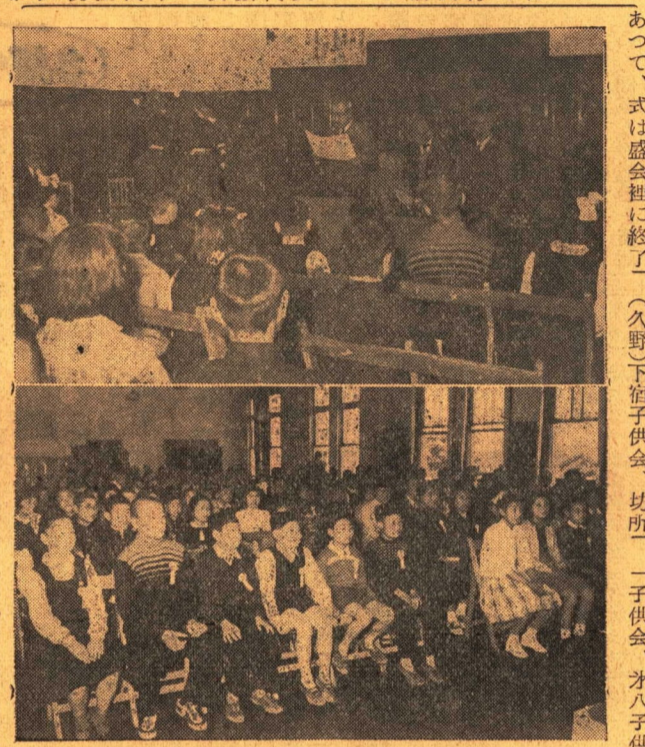
写真は優良子供会表彰式

五月九日の子供の日を祝して全国各地でいろいろな行事が行われましたが、小田原市でも市青少年福祉協議会の主催により、午前十時から、市議会議場において、協議会長の鈴木市長をはじめ、子供会代表者、来賓及び関係者多数が出席して優良子供会の表彰式が行われました。