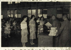
昭和三十一年赤十字会小田原赤十字会...