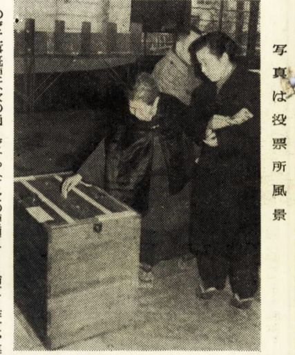
写真は投票所風景

直つての総合的施策と事業を推し進め、市民生活の向上に努めたいと志す所存であります。幸い、この再建計画は堅実に、順調に進められたことであることも、この機会に市民各位に御報告いたします。