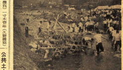
台風シーズンにそなえて = 早川で水防訓練 =

農業委員が増員されました 法律の一部改正により、農業委員が増員されました。法律の一部改正により、農業委員が増員されました。