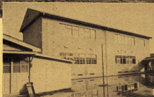
↑山王小学校校舎 工費365万7千円