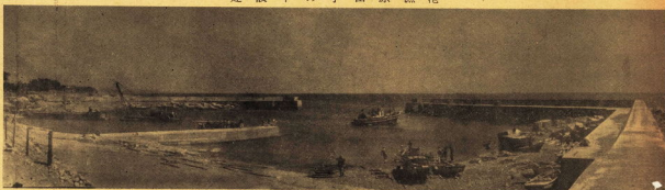
建設中の小田原漁港