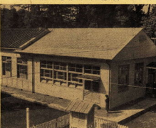
城内小学校図書館 工費79万円