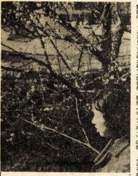
梅城址はじめてほろほろ