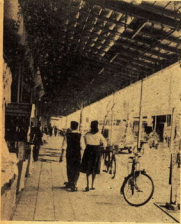
写真上は小田原池内池田組公園、下は完成した公共歩道(一丁田商店会)