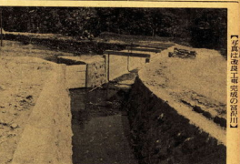
【写真】建設中の市立病院