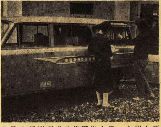
巡回文庫の自動車

十六日から配本を開始 星崎記念館にこのほど巡回文庫から図書館分館をはじめ、市内の婦 自の自動車がお目見得しました。