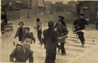
横断歩道における新玉小交通部長の活躍